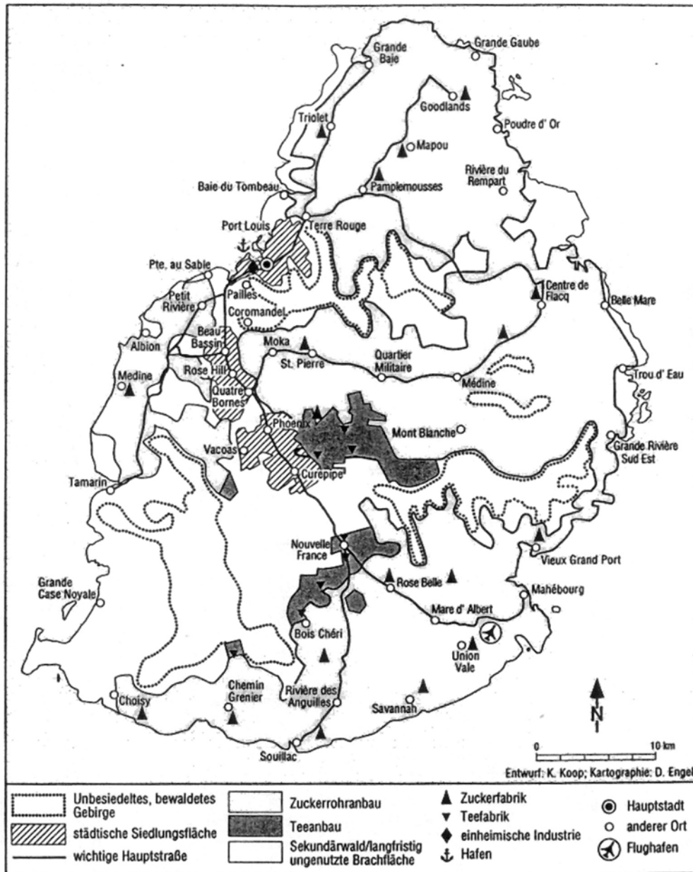
Abbildung 1: Funktionalräumliche Gliederung von Mauritius (Anfang der 1970-er Jahre)

Eine Wende in dieser abwärts gerichteten Entwicklung leitete in Mauritius die in den achtziger Jahren einsetzende Erholung des Welterdölmarktes sowie die fordistische Krise in den Industrieländern ein. Arbeitsintensive Unternehmen - vor allem der Bekleidungs-, der Automobil- und der Elektronikindustrie - verlagerten ihre Produktion zunehmend in lohnkostengünstigere Entwicklungsländer. Damit wird der Beginn der Globalisierung angesetzt (Hirsch, Roth, 1986), die den Ländern des Südens die Chance zu wirtschaftlicher Partizipation in neuer Form eröffnete und Aufschwung verhieß. In vielen Staaten wurden dazu seit Anfang der 80er Jahre Exportproduktionszonen (EPZ) eingerichtet (weltweit über 200; Fröbel, Heinrichs, Kreye, 1986). Doch nur wenige Länder konnten hiervon profitieren. Dazu zählte neben den "kleinen Tigern" in Ostasien auch der Inselstaat Mauritius (Abb.2).